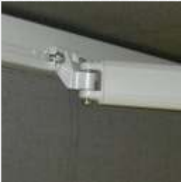
Käsivarren kiinnitys etuprofiiliin