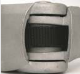
Käsivarsissa Dyneema® nauha